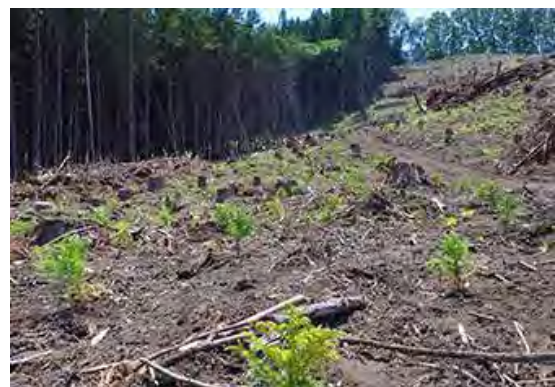
2021年春に新植した杉の幼木 (福島県)

このほかにも、ヒューリックでは、脱炭素に向けて、サプライチェーンに対する取組を新たに開始しており、建設に係る温室効果ガス排出量削減（建設現場における電力の再エネ化、リサイクル建材の使用、木造・木質化の推進等）を施工会社と協働して検討しています。