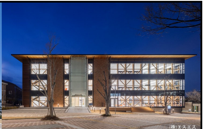
外観写真2：夕景・デザイン的に配置された木造のあらし部材