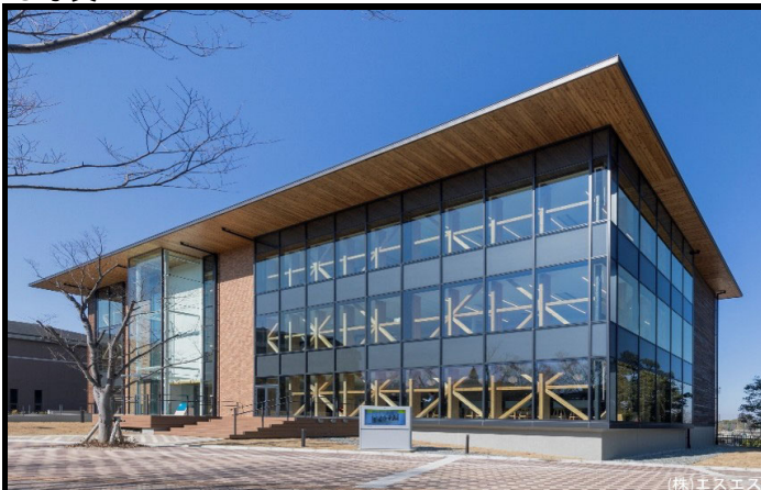
外観写真1：屋根底はCLTのはね出しとした木材素地の表情