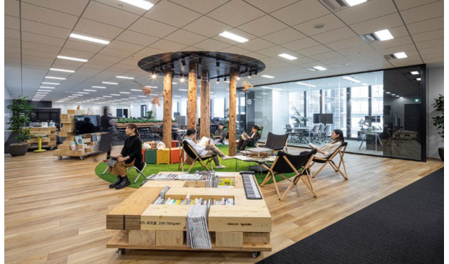
内部4: リチャージスペース